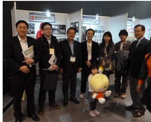
◆連合宮城の呼びかけで来場された 構成組織の組合員と家族の方々と 一緒に記念撮影◆