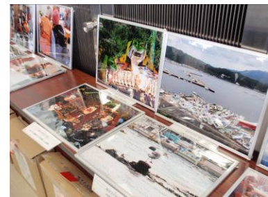
▲パネル展示で意識啓発

と題し、被災直後や現在の状況、復興計画などについて講演を受けました。さらに当時のボランティアリーダーから活動報告を受けた後、フリーディスカッションを実施しました。経営者側から「企業にはビジネスリーダーが不可欠。ボランティアに参加することで視野が広がり企業の活性化につながる。そのためにもボランティア休暇の整備、地域防災への貢献、災害時の従業員安全確保などに努めていきたい」との発言がありました。