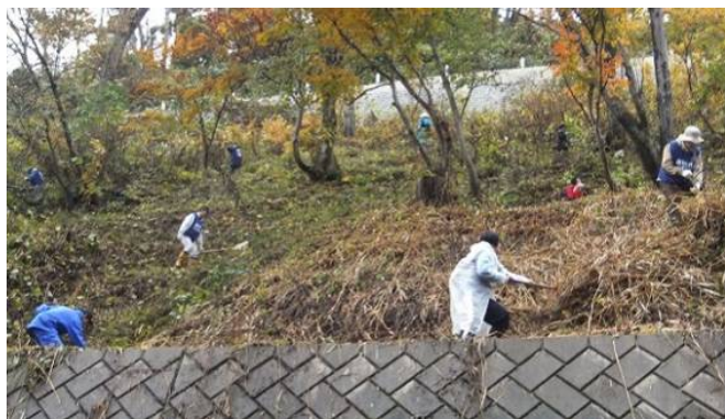
▲ カタクリ群生地の刈り払い作業