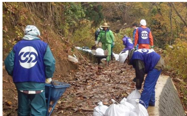
▲ 水路の土のう積み作業