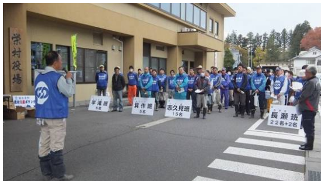
▲ 役場前で第1陣結団式

連合長野では、栄村と宮城県七ヶ浜町・石巻市・南三陸町の物産を斡旋する取り組みも展開しています。今後も“3.11と栄村を忘れない”取り組みを継続していきます。