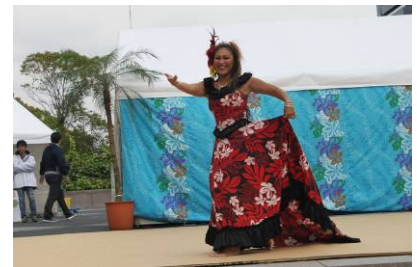
オープニングを彩る華やかなダンス

被災されて故郷を離れざるを得なかった皆さんに対する「心のケア」の重要性が大きく取り上げられている昨今、連合愛知では被災された方とともに楽しみ、励まし、時には被災者の皆さんから勇気をもらいながら、お互いに手を取り合って、被災地復興に向けた取り組みを進めています。