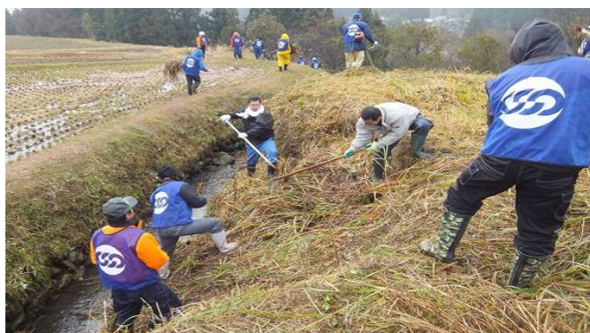
▲ 水路の刈り払い作業

本ニュースは、全国の皆さんの声をベースに発行していきます。「こんな取り組みしているよ」「今、現地はこうなっている」などの声や写真をぜひお寄せください。お待ちしております！