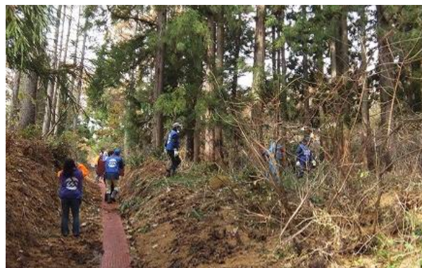
▲ 水路の蓋かけ作業