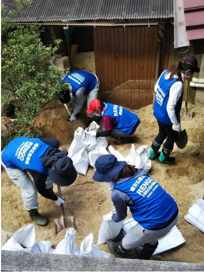
▲元の地面が見えないほどの土砂