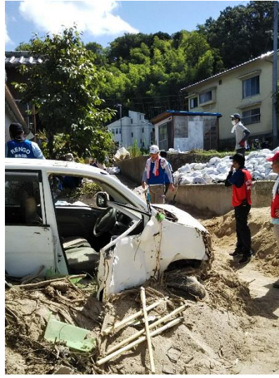
▲被害を受けた車が残っています