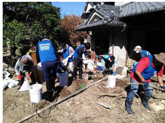
▲民家の玄関先での土砂撤去作業