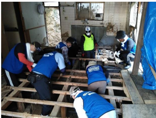
▲床下の土砂を掻き出す様子

広島では土砂撤去などの活動が継続しています。台風の影響で作業が中断することもあります。少しでも被災された方々のお役に立ちたいと、復旧・復興に向けてみなさん汗を流しています。