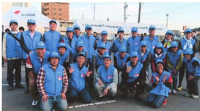
連合東京のみなさん