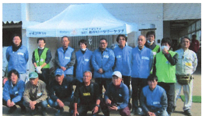
連合宮城のみなさん