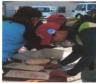
社協とマッチング先を確認