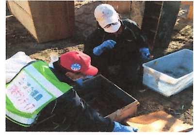
被災者の方と大切なものを整理