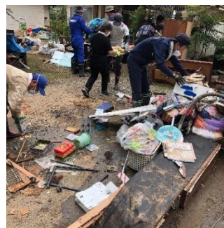
芦北での活動の様子