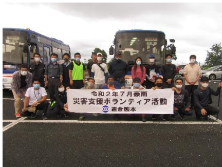
ボランティア活動出発式

7月20日（月）から開始された連合熊本の災害支援ボランティア活動には、20日（月）は芦北14名／人吉12名、21日（火）は芦北10名／人吉13名、22日（水）は芦北12名／人吉14名が参加しました。その他、県南地協独自で幹事会メンバー中心に八代ボランティア活動に、天草宇城上益城地協は、23日（木・祝）に6名が芦北ボランティア活動に独自参加しました。