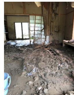
泥で埋まった家屋