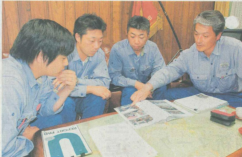
被災地で撮影した写真を見ながら語り合う 日鋼室蘭労組の派遣メンバー

連合室蘭に加盟する労働組合から東日本大震災被災地への救援ボランティア派遣が相次いでいる。連合本部の呼び掛けや産別独自の取り組みなど形態はさまざまだが、労働運動で培った団結力、奉仕の精神を発揮して民家からの泥除去、がれき撤去などに奮闘している。