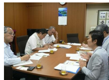
■ 辻元総理補佐官と南雲連合事務局長による会談（4 日・連合本部。左手前：南雲事務局長右手前：辻元補佐官）

あわせて辻元補佐官から、政府として、ボランティアが参加しやすい環境整備に努めるとともに、行政とボランティアの役割分担のあり方や、被災地救援におけるボランティアの貢献についての検証に努めるとの見解が示されました。