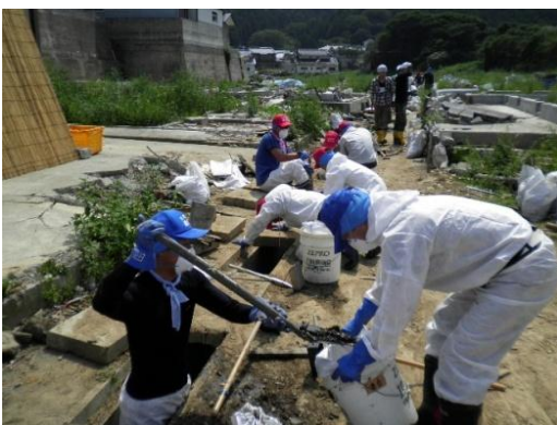
■腰まである深さの側溝から泥を出す（16日・石巻市）