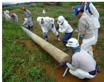
■耕作の邪魔にならないよう、電柱を畑の端に寄せる