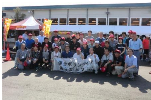
■マイヤ労組のみなさんと共に。後ろは仮店舗。

マイヤ労組の仲間をはじめ、連合の組合員は、職場の復旧・再建と地域の復興のため、それぞれの持ち場で日々奮闘しています。被災地をはじめとした職場での頑張りとは、全国から被災地を物心両面で支える取り組み、それぞれの立場で役割を發揮し、被災地復興につなげましょう！