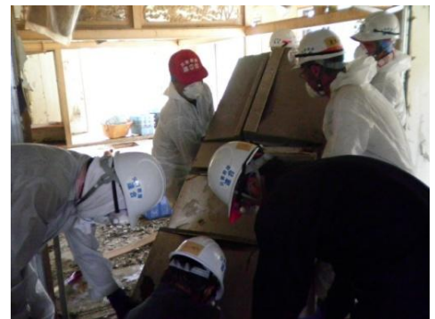
■津波に浸かった冷蔵庫を運び出す（11日・石巻市）