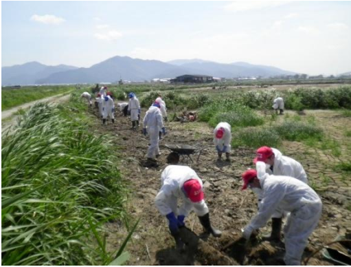
■田んぼでの漂流物撤去作業（9日・石巻市）

【8/16】気仙沼市小々汐で、個人宅での床下からの泥出し、食器洗浄などの作業を実施。