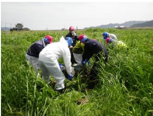
■津波が押し寄せた田んぼにも今は草が生い茂る。その中で漂流物を探し出す（10日・石巻市）