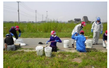
■東松島での側溝作業の様子(26日)

【7/26】気仙沼市波路上（長磯）二本松で田んぼのガレキ撤去、漂着した海の家シャワー室などの撤去作業を実施。