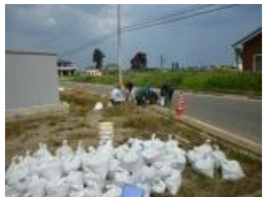
■側溝の泥出し作業と積み上がる土のう（16日・仙台市宮城野区）