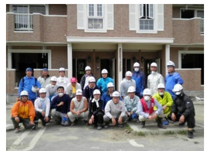
第15陣 宮城・美里チームのみなさん (22日・石巻で撮影)