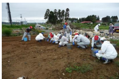
■全員で木片、ガラス片などを回収

【8/23】気仙沼市波路上地区で畑のがれき、農業用ポンプ、電柱の移動・撤去、除草作業を実施（下写真）。