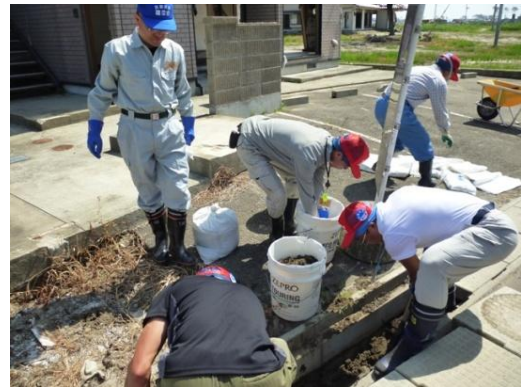
■住宅地での泥出し作業（10日・仙台市宮城野区）