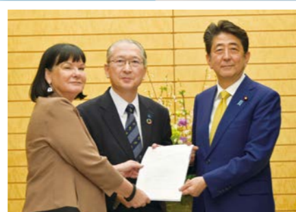
パロウITUC書記長とともにG20大阪サミットに向けた労働組合声明について安倍総理に要請（2019年3月18日）