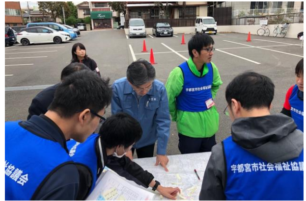
▲現地での被災状況を聞かせてもらいました