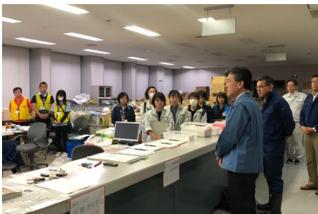
▲伊達市のボランティアセンターを激励訪問