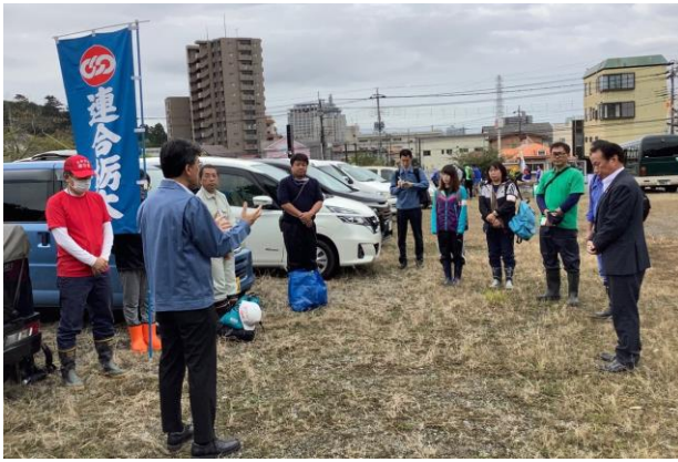
▲連合栃木ボランティアチームを激励