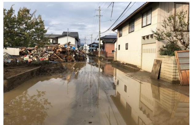
▲千曲川氾濫の爪痕が残る穂保地区