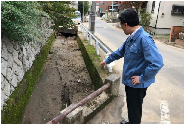
▲宇都宮市内 水路には大量の泥が