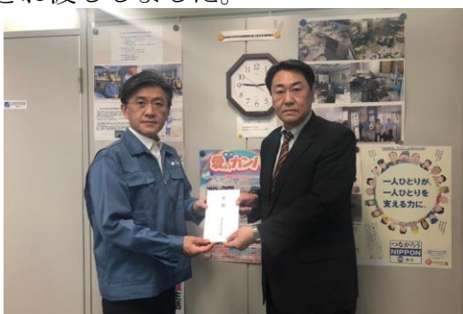
連合宮城の大黒事務局長(右)へ

連合宮城、連合福島、連合栃木、連合長野にそれぞれ第1次緊急支援として各200万円をお渡ししました。