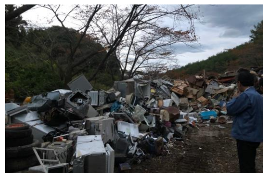
▲災害廃棄物置き場