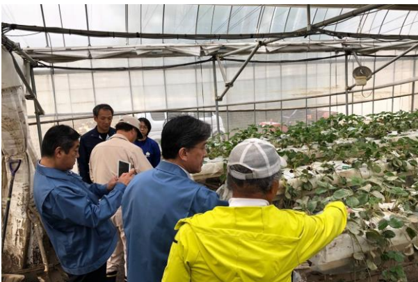
▲農家も大変な被害を受けています