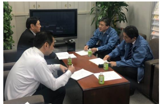
▲連合宮城との緊急対策会議