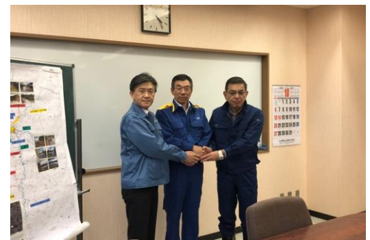
▲伊達市長(中)と固い握手