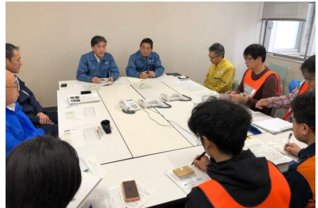
▲長野県災害時支援ネットワークと情報共有