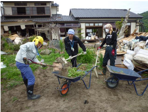
■家屋での土砂・がれき撤去作業の様子。いたるところ砂・砂・砂(13日・いわき)