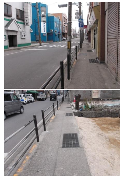
■連合ボランティア隊が活動した宮古市大通地区。側溝周辺もきれいになっている。

しかし、これから梅雨を迎えるに当たって、側溝の水はけを良くしておくことは、水害を未然に防ぐことにつながり、宮古市にとっても喫緊の課題です。連合ボランティアの日々の地道な活動は、確実に地域の復興に向けた一助となっています。