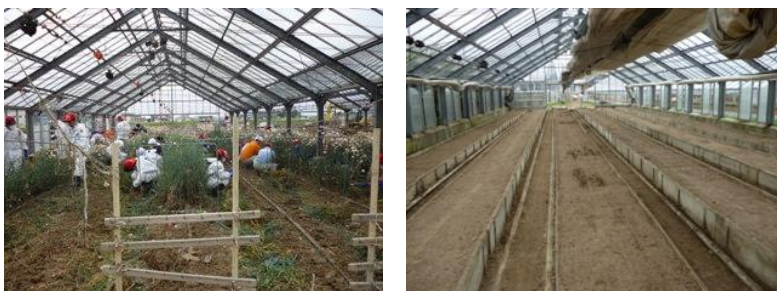
■カーネーション農家での作業。 左：泥出し、清掃作業中 右：作業後、整頓された温室