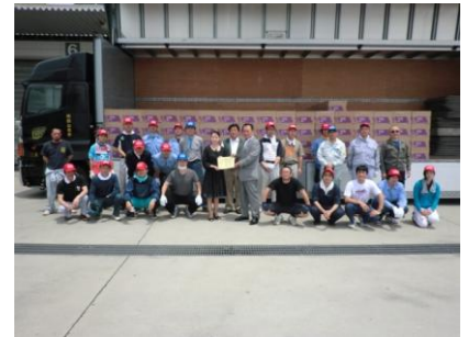
■連合ボランティアも参加して行われた飲料水の受け渡し式

【6/16～18】郡山市、会津若松市で活動。郡山市及びその周辺の避難所での炊き出し、連合福島に寄贈された飲料水の搬入、野菜カット、被災者の引越し手伝い。会津若松班は、支援物資センターでの物資の配布・搬入・整理。18日には、仮設住宅100に米を配りながら、各戸の生活状況やニーズ聴取を行う。