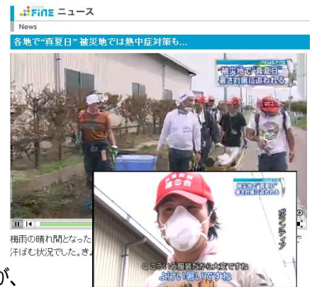
■ニュース映像

ニュースは連合の活動を取り上げるものではありませんでしたが、画面には「連合・災害救援」の帽子やワッペンが何度も大写しに。思わぬ形でしたが、必要な対策をとりながら活動する連合の取り組み紹介となりました。