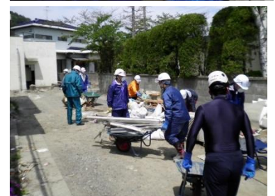
■(写真上)病院のトイレ内壁を清掃中。 (写真下)病院の屋外通路も片づける。