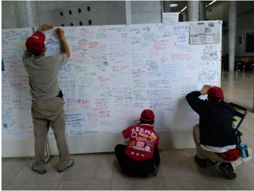
■気仙沼・本吉ボランティアセンターには全国から参加したボランティアが残した寄せ書きがある。連合のボランティア隊も復興を祈りメッセージを残す。(10日)