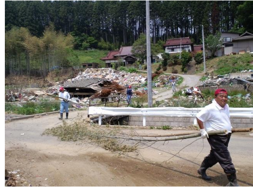
■寺から背丈の数倍ある竹を運び出す(10日・気仙沼)