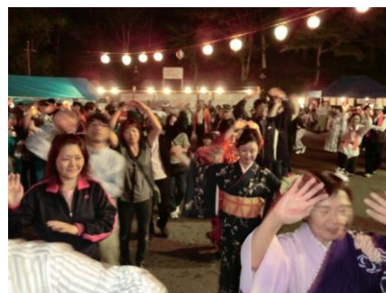
■温泉祭りで踊りの輪に加わる連合ボランティア