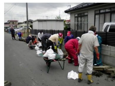
■地元の方々と一緒に作業（25日）

【6/26】石巻市鹿妻北地区で連合山形からの近県対応チーム（31人）と合同で側溝からの泥出し作業を実施。この日は雨天だったが、ボランティアセンターが団体での活動については決行の判断をしたため、降りしきる雨の中での作業となった。