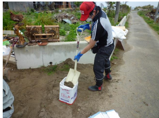
■一人で土のう詰め作業ができる、通称“土のうマシン”が活躍中。実は一斗缶の上下面を取り去った四角い筒。(13日・いわき)