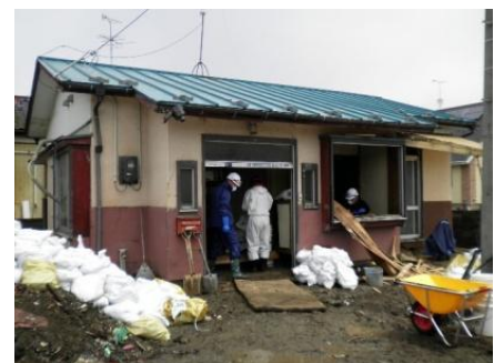
■泥出し作業の後、仮設住宅用として改装される予定(石巻)

現地から 今回作業した家屋は、津波で屋内はめっちゃめっちゃになったが、建物自体は仮設住宅向けに改装されるとのこと。日が差すととにかく暑くなるので、暑さ対策が必須です。今回は水の確保で苦労する中、石巻地区のJAMの皆さんのご厚意により高圧洗浄機と給水車を用意していただきました。機材の洗浄が大変はかどりました。