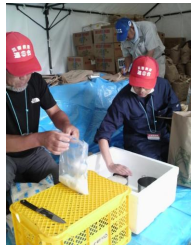
■仮設住宅の被災者に届けるコメの小分け作業。9リットルずつ計量して袋に詰める。(12日・郡山)