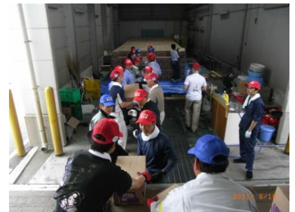
■福島・会津両地チームが協力して運搬作業に着手。リレー方式で2時間集中して、1600箱の移動を完了させた。

【6/16】連合福島が中国領事館(新潟)から寄贈を受けた飲料水1600箱(1箱700ml24本入り)を、NPOハートネットふくしまの活動拠点に搬入するため、同所に貯蔵してあった米を別の倉庫に移動した上で、福島拠点・新地班とともに飲料水の搬入作業。2時間かけて手渡して1,600箱を移動させるハードな作業。