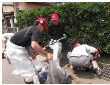
■写真左：出発前、社協でラジオ体操 写真右：津軽石地区での側溝清掃 (22日・宮古)