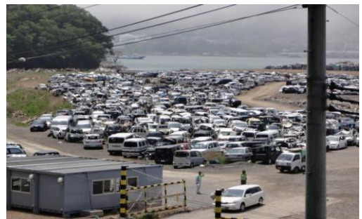
■この集積所に集められた被災車両は約3,000台。ここから廃車手続きをする車を探し、ナンバープレートを外す。