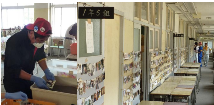
■回収された写真を洗浄する。写真を傷めず津波の泥を落とすため、慎重さが求められる。きれいになった写真は掲示され、持ち主を待つ。(14日・相馬)