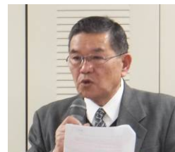
↑連合千葉・米倉災害ボランティアチームリーダー ↓分散会のような