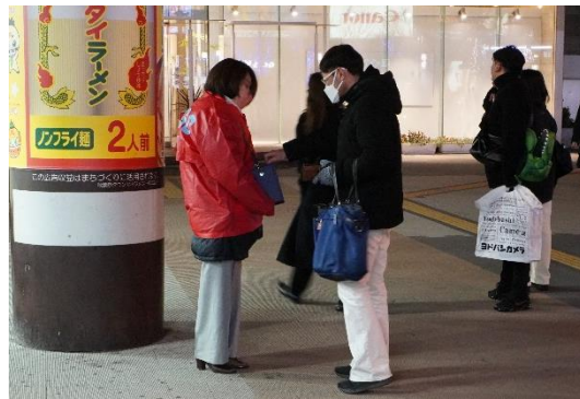
JR秋葉原駅前でカンパの様子